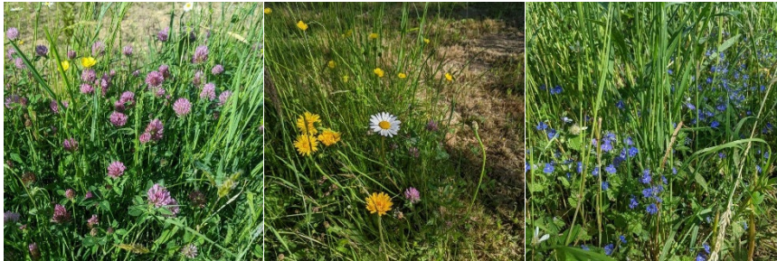
Toutes ces plantes font le bonheur de dizaines d'espèces d'insectes menacées

Essayez la tonte différenciée, expliquez votre démarche à vos amis, votre famille et voisins, les retours seront alors bien différents !