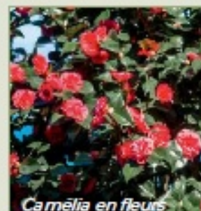
Camélia en fleurs