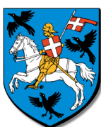
Ville de Mutzig

Pour plus d'informations, contactez le : Centre Communal d'Action Sociale de la ville de Mutzig 4, rue de l'Église 67190 MUTZIG @: ccas@villedemutzig.fr tel: 03.90.40.95.04