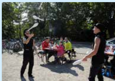
Animations à Mutzig : Passage du Biker 1 par TRACE VERTE Démonstration des Arts du Cirque par l'association « TOP OF THE GAME »

démonstrations des arts du cirque et de cycle-ball, initiation au BMX, exposition de véhicules anciens... Une collation et un foulard en microfibre ont été offerts à tous les participants.