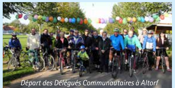
Départ des Délégués Communautaires à Altorf

La manifestation a été plébiscitée en rassemblant plus de 2750 cyclistes, de tous âges, sur les liaisons cyclables du territoire ! De nombreuses animations ont été proposées sur les différents points de départ : parcours à vélo,