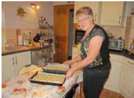
LES DELICES DE GERMAINE 9 PASSAGE DES POILUS 06 31 35 95 30