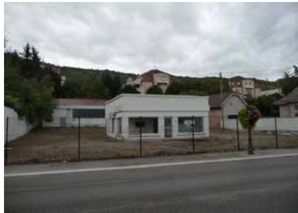
Site de l'ancienne station service du boulevard Clémenceau

En fin d'année, le conseil municipal a décidé d'exercer le droit de préemption urbain afin de se porter acquéreur de la propriété correspondant à l'ancienne station-service au 10 boulevard Clémenceau. Cette propriété de 16,24 ares comporte un ancien bâtiment commercial et un hall de 300 m 2 qui est d'ores et déjà utilisé comme annexe de stockage des services techniques municipaux.