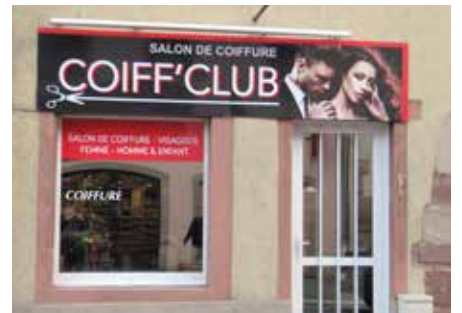
COIFF' CLUB 20 RUE DU MAL FOCH 03 88 38 51 29