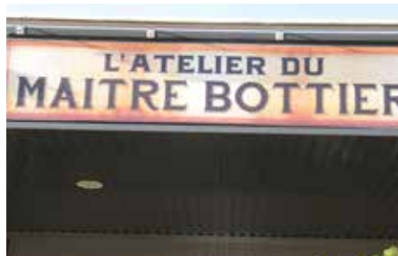
L'ATELIER DU MAITRE BOTTIER CC des Brasseurs Rue Du Matfeld 03 90 24 66 72