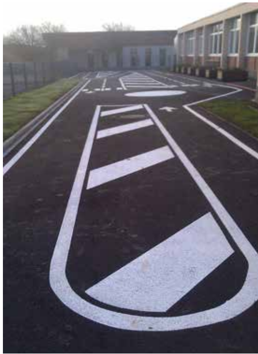
Cour est de l'école Banzet

Différents travaux ont été réalisés au niveau des écoles, tels que la rénovation d'une salle respectivement à l'école Rohan et à l'école Schickelé permettant notamment d'accueillir les ateliers des activités péri éducatives. Une grande partie de la cour de l'école Banzet a été refaite ainsi que le sol amortissant des aires de jeux des écoles Banzet et Scheppler (celui de l'école Génie avait également été rénové).