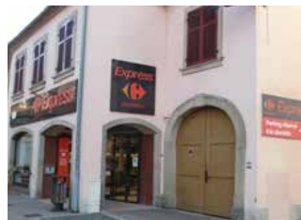
CARREFOUR EXPRESS 21 RUE DU MARECHAL FOCH 03 88 38 13 91