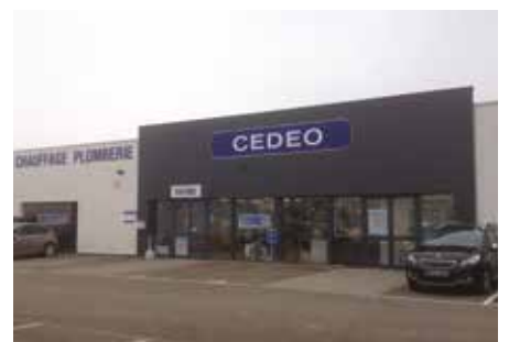
CEDEO ESPACE ATRIUM 03 88 38 85 08