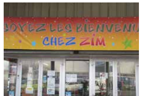
LA PISTE DE ZIM ESPACE ATRIUM 10 RUE HERMES 03 88 81 27 12