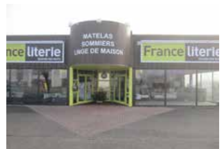
FRANCE LITERIE ESPACE ATRIUM RUE HERMES 03 88 38 36 88