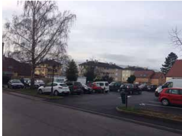
Place de Freisen

En fin d'année, le conseil municipal a décidé d'exercer le droit de préemption urbain afin de se porter acquéreur de la propriété correspondant à l'ancienne station-service au 10 boulevard Clémenceau. Cette propriété de 16,24 ares comporte un ancien bâtiment commercial et un hall de 300 m 2 qui est d'ores et déjà utilisé comme annexe de stockage des services techniques municipaux.