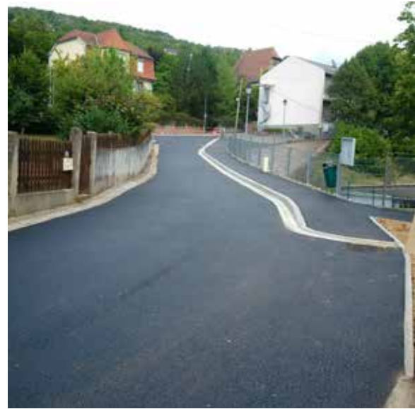
Rue du Génie aux abords de l'école maternelle

Les travaux ont permis la réalisation d'un trottoir entre le parvis de l'école et le cheminement piétonnier descendant vers l'école Schickele, la création d'une plateforme surélevée pour la sécurité des piétons devant l'école et d'une place de stationnement PMR. Enfin des travaux périphériques ont également été réalisés par l'ajout de 2 candélabres d'éclairage public à proximité et un réaménagement global du talus végétal situé entre les 2 écoles.