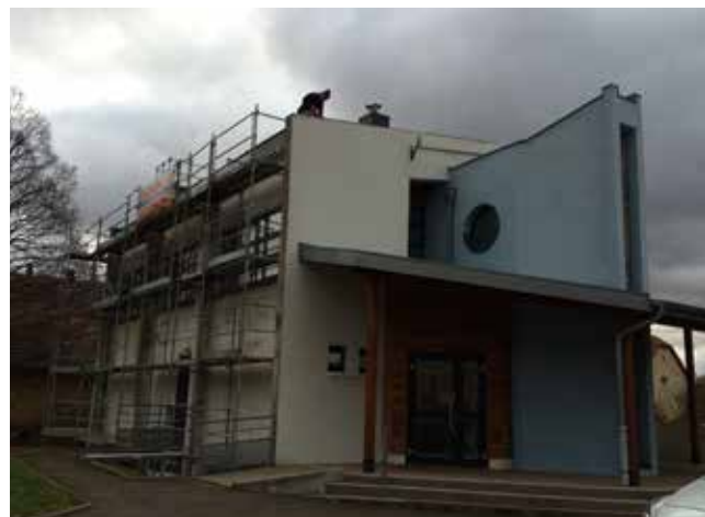
Ravalement des façades du temple protestant

La commune a réalisé le ravalement des façades latérales et arrière afin de parachever la rénovation du temple protestant qui avait programmé dans le cadre du Contrat de Territoire de subventionnement avec le Conseil Départemental.