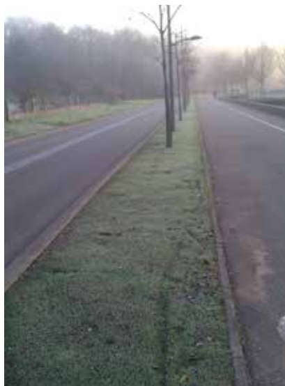
Massifs route des Loisirs