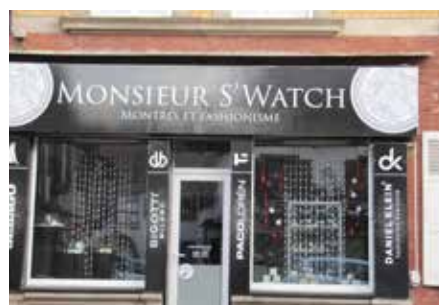
MONSIEUR S'WATCH 30 RUE DU MARECHAL FOCH - 03 69 73 50 75