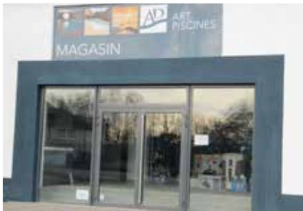
ART PISCINES CITE DES ARTISANS 1 PLACE DE L'ABATTOIR 06 86 79 42 09