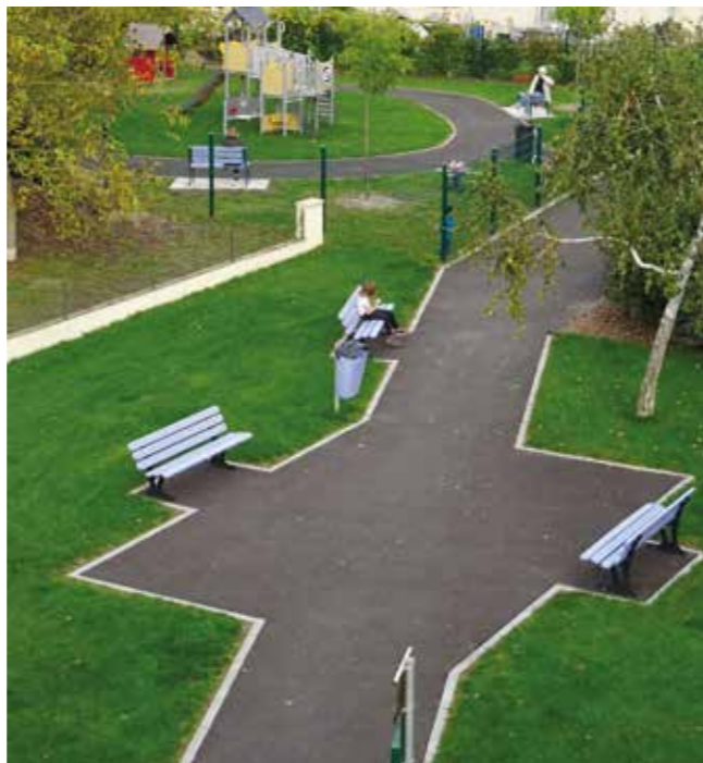
Le square et l'aire de jeux entre la rue Haberland et la rue du Wege

Le service technique municipal a parachevé l'aménagement du square situé entre la rue Haberland et la rue du Wege et a installé les agrès de l'aire de jeux du lotissement Leimen qui font le bonheur des enfants.