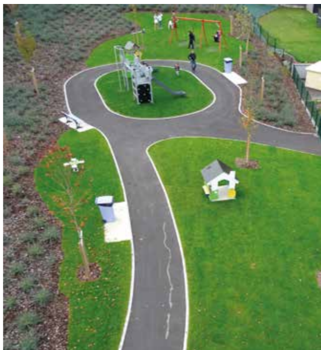
L'aire de jeux du lotissement Leimen

Le projet de réaménagement du bâtiment annexe de la mairie, en locaux de permanence de services publics et bureau de police municipale intercommunale, avance sur le plan des formalités administratives et le Conseil Départemental est en train de finaliser l'instruction du dossier de subvention.