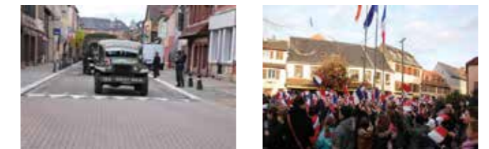
Commémoration de la libération de la ville de Mutzig le 26/11/2019