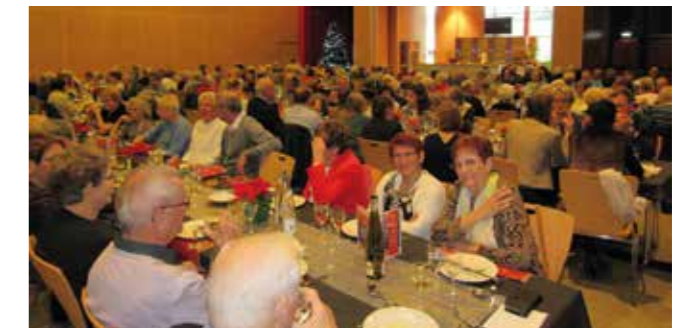
Repas des aînés de la ville de Mutzig