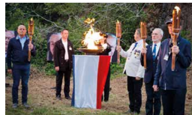
Cérémonie d'hommage au Struthof