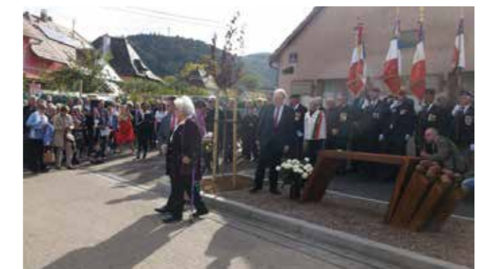
Dévoilement d'une stèle à La Broque