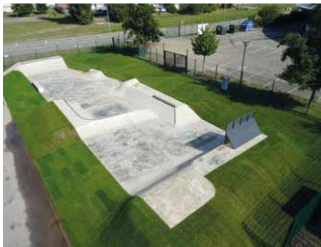
Le skate park rue du Matteld

La cour et le parking du centre de secours des sapeurs-pompiers ont été aménagés en enrobé dans le cadre d'un partenariat financier entre la commune et le Service Départemental d'Incendie et de Secours. La commune a profité de ce chantier pour rénover le carrefour entre la rue du Château et la rue du Commandant Clerc en y aménageant un plateau surélevé.