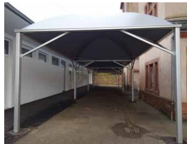
Le préau de l'école R. Schickelé

Le service technique a réalisé divers travaux dans les bâtiments scolaires: la rénovation d'une salle de classe à l'école Rohan et à l'école R Schickelé, l'installation d'une série de nouveaux stores à l'école Scheppler et à l'école Schickelé, la mise en place d'un contrôle d'accès à l'école Banzet et à l'école Rohan, enfin l'aménagement du sol du coin jeux extérieur de l'école maternelle Génie avec une base de gazon et une structure alvéolée amortissante.