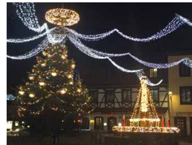
Les illuminations de Noël du centre-ville