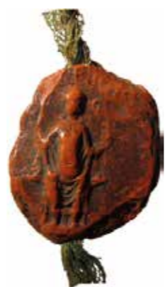
AMM, JJ 1 - sceau détaché [sans date]. Empreinte du premier sceau du secret de Mutzig dont l'usage est attesté (pour l'instant) entre 1414 et 1553. http://www.sigilla.org/fr/sgdb/empreinte/40646

Vous pouvez également rejoindre les équipes en train de se former pour numériser les sceaux du Bas-Rhin (à Molsheim et Strasbourg notamment) en écrivant à la SHME : ashme@hotmail.fr ou directement à thomas.brunner@unistra.fr