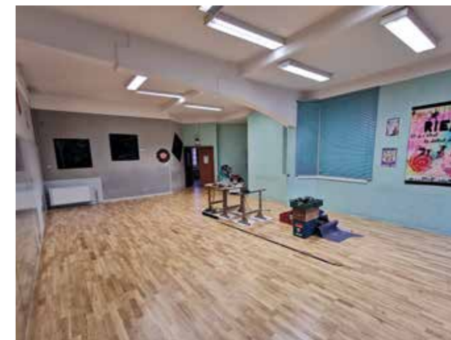
La salle de danse du Centre culturel du Château des Rohan

L'année s'est achevée avec une réorganisation des décorations de Noël par l'installation du sapin sur la place de la Fontaine et le renouvellement des illuminations de cette dernière.