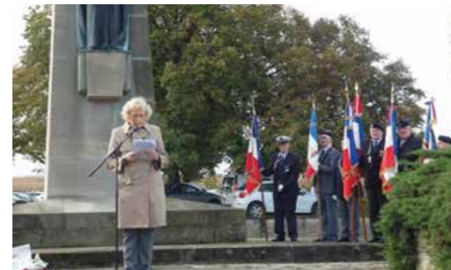
Cérémonie au Geisberg (Wissembourg)

« LE SOUVENIR FRANÇAIS » observe la plus stricte neutralité politique, confessionnelle et philosophique .