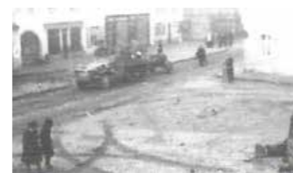
Novembre 1944 (après le 26) : Mutzig, passage d'un half-track place de la Fontaine.

Les opérations pour la prise de Mutzig par la 3 e Division d'infanterie US eurent lieu les 25 et 26 novembre 1944. Les Américains ont été arrêtés pendant plus de 18 heures. Les Allemands avaient mis en place un verrou à la sortie de la vallée de la Bruche. Ils installèrent un barrage antichar sur le boulevard Clemenceau à la hauteur de la Maison Grettner. Un chasseur de char était positionné dans la descente dans Mutzig à la hauteur du Laboratoire. Il pouvait tirer par-dessus le barrage antichar tout en étant invisible, car caché par le dénivelé. Il a d'ailleurs touché un char américain à la hauteur du chantier de fouilles. D'autres chasseurs de char étaient positionnés dans la ville aux endroits stratégiques. Un autre barrage antichar était établi à la hauteur du garage Dahlen.