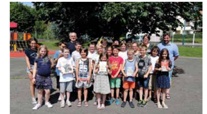
Récompense scolaire à Sultz les Bains

E-mail : souvenirfrancaismolsheim@gmail.com