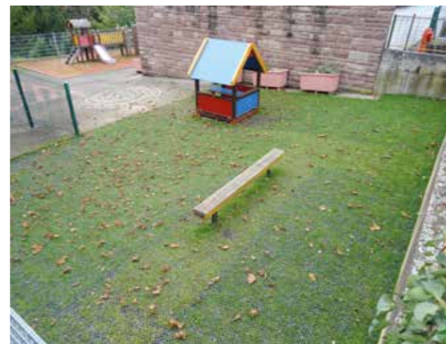
L'espace de jeux de l'école maternelle Génie

Le service technique également intervenu d'autres bâtiments communaux en procédant au remplacement du sol de la salle de danse du Centre culturel du Château des Rohan par un parquet technique spécifique pour les activités de danse, ainsi qu'à la rénovation complète des 8 chambres avec sanitaire et douche