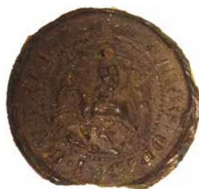
AMM, DD 2 - sceau de Berthold Ier de Teck, évêque de Strasbourg (1223-1244), attaché à une charte de 1243 par des lacs de soie verts. C'est le plus ancien sceau conservé à Mutzig. http://www.sigilla.org/fr/sgdb/empreinte/40646