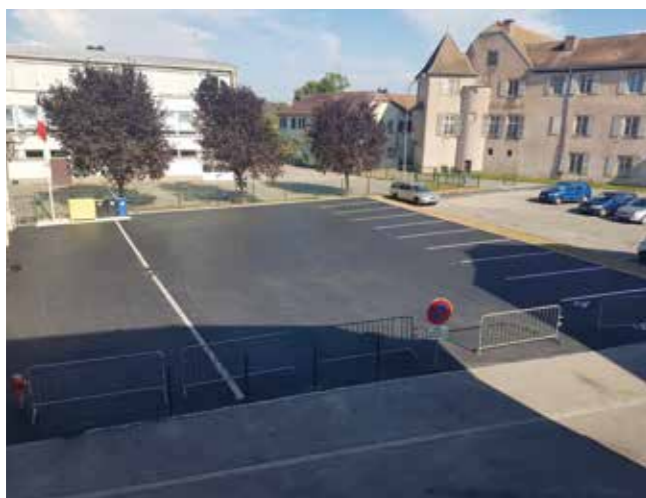
La cour de la caserne des pompiers

Le service technique municipal a parachevé l'aménagement du square situé entre la rue Haberland et la rue du Wege et a installé les agrès de l'aire de jeux du lotissement Leimen qui font le bonheur des enfants.