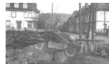
Mutzig, chasseur de char allemand détruit près du passage à niveau à côté de la gare.