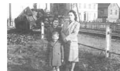
Mutzig, photo souvenir devant ce même chasseur de char.