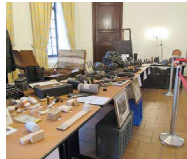
Exposition de matériels et d'uniformes militaires de 39/45

Le mardi 26 novembre 2019 à 14h sur la place de la Fontaine une cérémonie commémorative du 75 e anniversaire de la libération de MUTZIG en présence du 44 e RT, des associations patriotiques et de nombreux véhicules militaires américains d'époque accompagnés par les élèves des écoles SCHICKELE ET ROHAN qui ont interprété la Marseillaise, le Chant des Partisans et Mille Colombes.